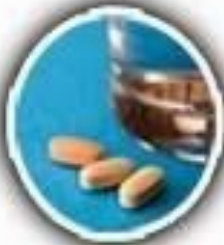
Analgésicos para personas y animales de compañía