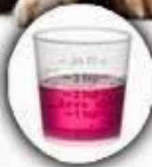
Medicamentos para el resfriado y la alergia