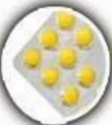
Pastillas de cafeína