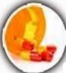
Medicamentos para el corazón